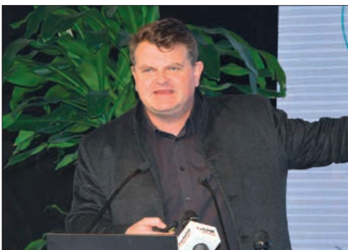
كيوي ببرجمان يلقي كلمته