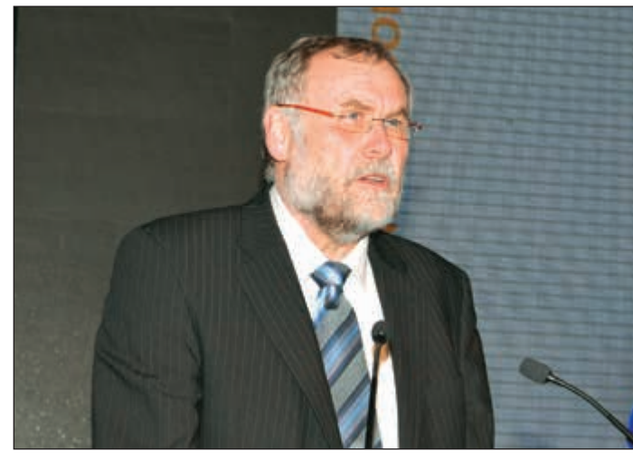
رئيس المنظمة العالمية للأسطح الخضراء رونالد ابل