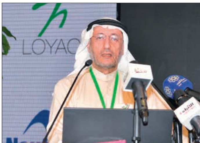
خالد الفوزان يفتتح المؤتمر