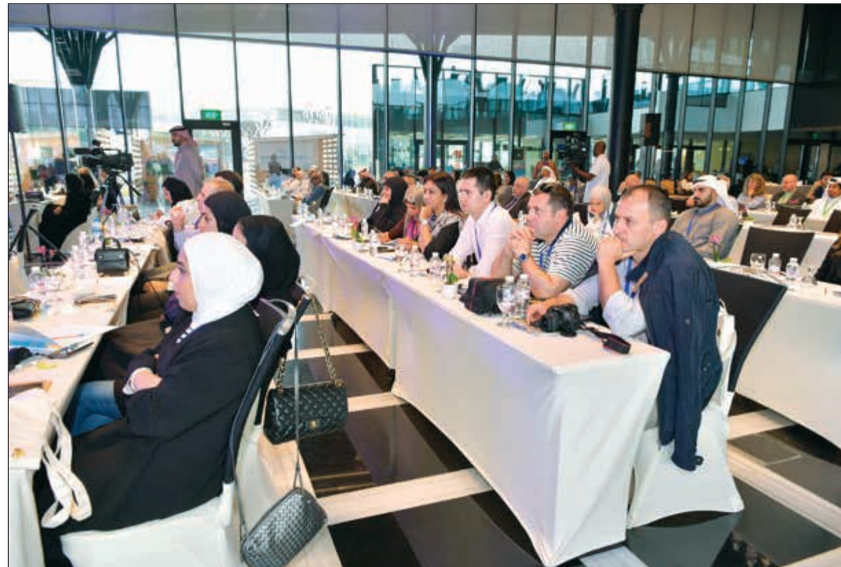
حضور كثيف لتابعة أعمال المؤتمر